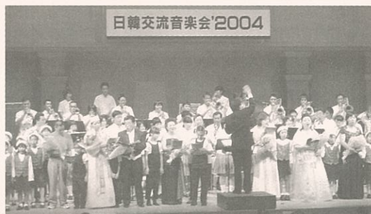
▲韓国の歌「コヒャンエボム(故郷の春)」と日本の「ふるさと」を大合唱