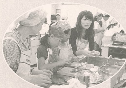
▲午前中の料理では、イタリアンリゾットとメキシコのタコスをつくりました。