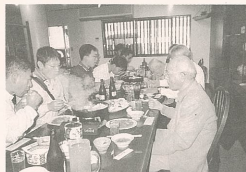
▲韓国留学生との交流のようす