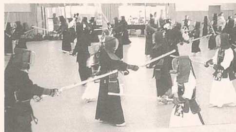
韓国釜山市少年剣道交流団が来伊合同練習のようす