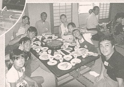
▲これからみんなで「いただきま〜す」