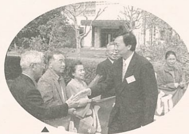
▲参加の市民と握手(市日中友好協会の方々も歓迎)

私は、初めての伊万里市訪問でしたが、市長様をはじめ市民の皆様方の熱烈な歓迎をいただき、梨ワインと新鮮で軟らかい牛肉を味わい、精巧で美しい焼き物を鑑賞するなど深い印象が残りました。特に、市長様はじめ多くの市民の皆様が休日返上でアカシアの記念植樹を行ってくださったことは、生涯忘れられないでしょう。今回の視察を通して、伊万里市をより印象深く理解し、両市の友好協力関係がより強まり、更に固く結ばれていくと確信いたしました。