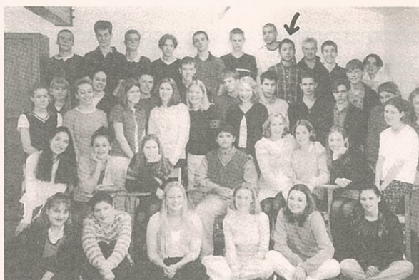
▲クラスメートたちと(後列チェックのシャツが筆者)

アメリカではケンカもしたし、アホなこともしたし、悩んだこともありました。また、日本では報道されなかったけど、スポーケンで留学生の女性2人が拉致される事件があり、9時間後に無事保護されたけど足にはスタンガンを押し当てられたあとがあったと聞いたので、すっげえ恐かったらと思います。どこでも事件はあるけど、誰もがそれに恐れず色々なことに挑戦して前に進んでいってほしいと思いました。今思えば、すべて過去の出来事ですが、一つ一つの経験が今の自分のキャラクター(個性)をつくっていると思います。