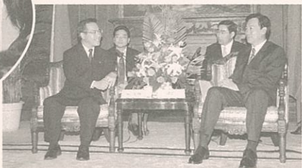
▲大連市長との会見