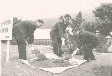
▲中国大連市において、イヌマキの記念植樹(7月)