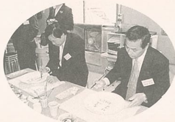
▲大川内山にて楽焼き