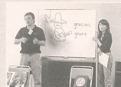
▲イタリア語とメキシコの言葉(スペイン語)の「ありがとう」はとても良く似ていました。「④グラツィエ、⑤グラシアス」ふたつの言葉は同じラテン語の子孫だそうです。