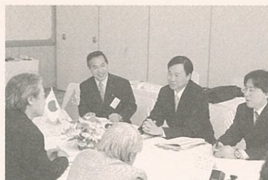
▲日本側マスメディアへの会見