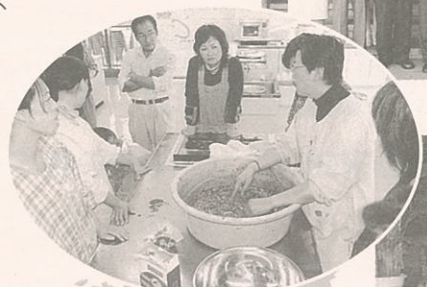
▲初級韓国語教室のキムチ会のようす