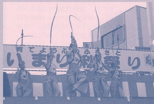
▲山東省歌舞劇院の華やかな舞が秋祭り会場にて披露されました。