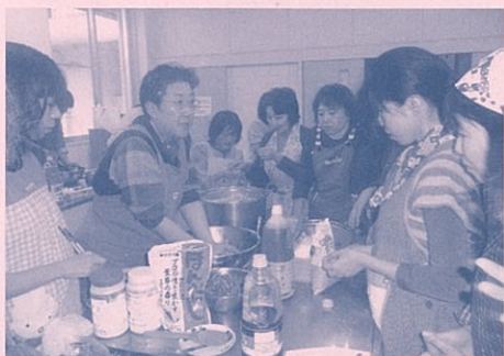
▲韓国語教室でキムチ作りを体験しました。