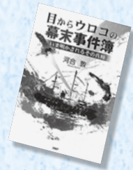
『目からウロコの幕末事件簿』

目まぐるしく情勢が変化した幕末。多くの偉人が生まれ、日本を歴史的出来事だと思つてきた事件の一部が、実は間違っていたこと。近年の研究でもわかってきた。日本史の現役教師である著者が、残された資料から幕末の事件を読み解き、その真相に迫ります。