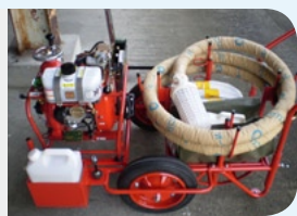
→ピカピカの軽可搬消防ポンプ

市では、財団法人日本消防協会から助成を受け、『松浦町宿分婦人消防隊』の活動を支援する備品として、→ピカピカの軽可搬消防ポンプなどを購入しました。今後、地域における初期消火活動の向上と火災予防の普及が期待されています。