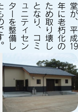
→黒川町立目に完成した深山コミュニティセンター

深山自治会(清水横野立目、牟田地区)が整備をしていた深山地区コミュニティセンターが完成しました。これまで地域で集会所として利用してきた旧黒川小学校立目分校の講