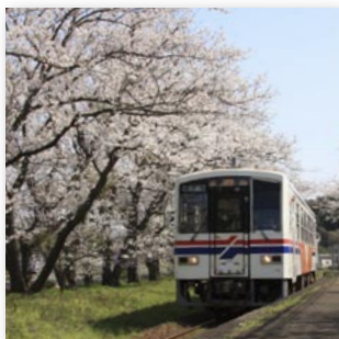
↑満開の桜の中を通過する列車