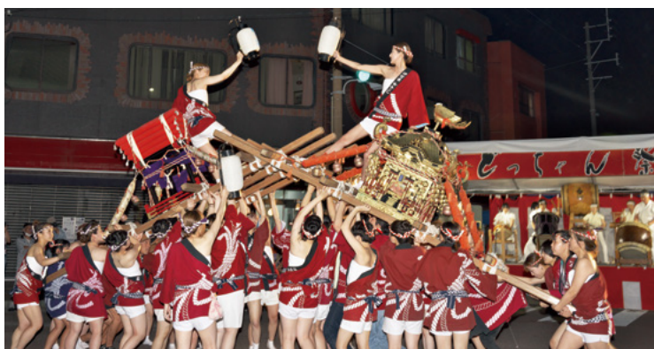
↑祭りの最後を飾るにふさわしい迫力で観客を魅了した昨年の女みこし