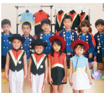
↑ 上着やスカートなど6種類の衣装などが贈られました

衣装を贈られた園児たちは「素敵な衣装をありがとうございます!」と嬉しそうに話していました。