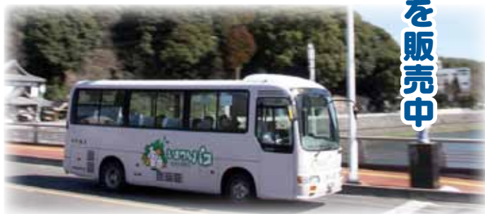
↑まちなかを走る『いまりんバス』(市街地線)