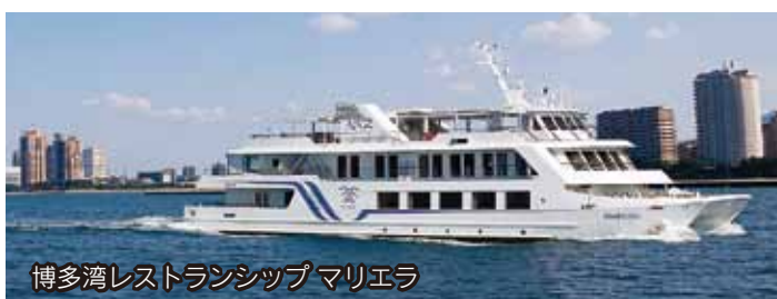
博多湾レストランシップ マリエラ