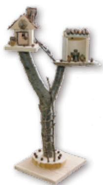
→テーマ部門 『ピノキオのかぞくのいえ』