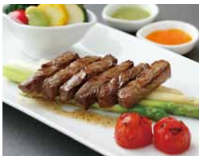
↑中国料理『カリユウ』で提供される『伊万里牛ロースの煎り焼き』