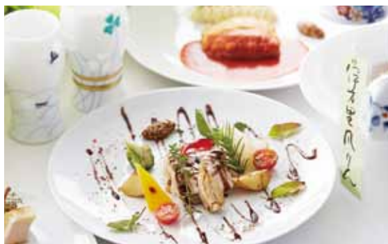
←フェア限定メニュー(写真2枚)