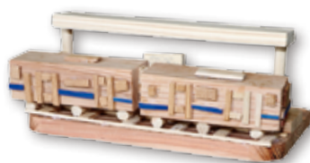
↑フリー部門『ゆめのえき』