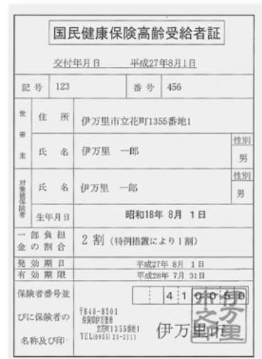
国民健康保険高齢受給者証 (桃色)

これまでの古い被保険者証・高齢受給者証は、8月以降使用できません。第三者に悪用されないように、はさみなどで必ず裁断し、燃えるごみとして処分するか、市役所または出張所に返却してください。