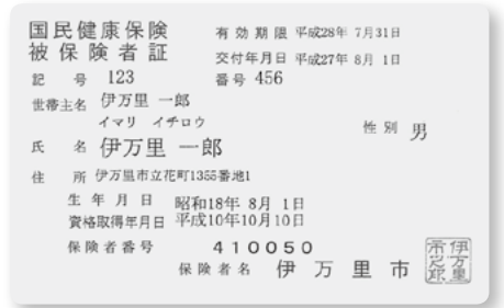
国民健康保険被保険者証 (黄色)