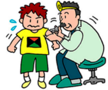
【表】幼稚園・保育所などの年長児、小・中学生などを対象にした予防接種