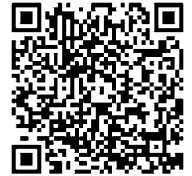
『ふるさとチョイス』 伊万里市情報QRコード

個人が、市に対して2,000円を超える金額を寄付した場合、2,000円を超えた部分について、所得税と個人住民税の控除（個人住民税所得割の2割まで）を受けることができる制度です。 ※所得税や住民税が非課税の人は、控除の対象になりません。また、所得額などの条件により控除を受けることができない場合があります。