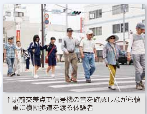
↑駅前交差点で信号機の音を確認しながら慎重に横断歩道を渡る体験者

6月1日、市民センターを発着点として、『第20回白い杖で街を歩こう会』が開催されました。これは、誰もが住みよいバリアフリーのまちづくりと視覚障害への理解と関心を深めてもらうために、参加を広く市民に呼びかけ、伊万