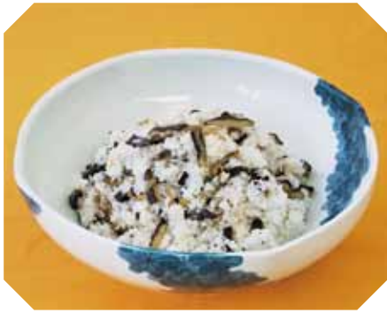
おいしいなすで手軽に作れます ナスびご飯